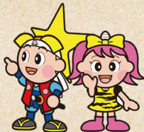
岡山県マスコット「ももっち・うらっち」